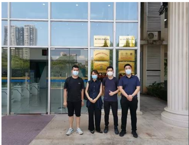
支援现场神州数码员工

2021年厦门发生疫情，神州数码人义无反顾投身战疫行动中。2021年9月，厦门市工信局、市信息中心通知，为积极支援厦门同安抗疫，急需多名志愿者IT技术人员到核酸检测现场信息中心支援，协助现场软硬件系统调试工作。在接到通知后，神州数码厦门办事处的同事积极响应，一支以产品工程师和系统工程师为主的技术人员队伍迅速成型并火速赶往检测一线，配合众多专家与现场医护人员共同完成现场的信息系统安装调试工作，为后续的检测服务的高效展开打下坚实基础。