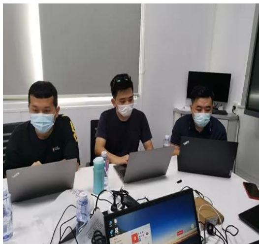
神州数码工程师在现场进行调试