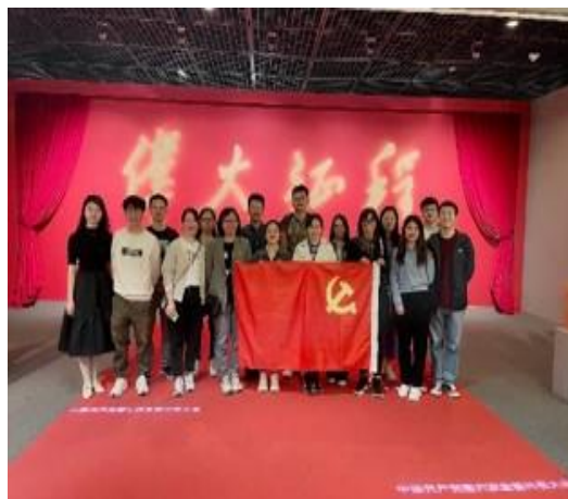
教育基地参观学习