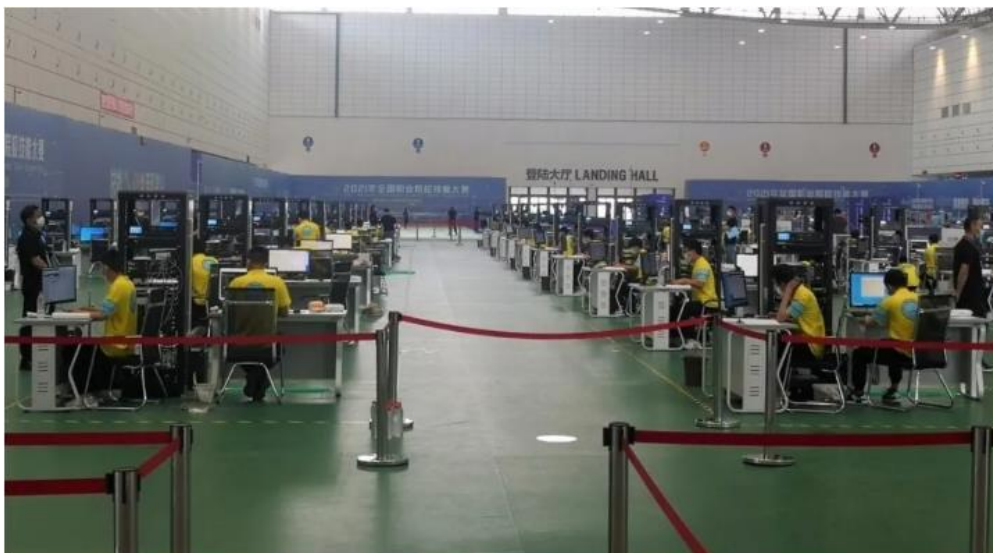
“2021 年全国职业院校技能大赛”现场

“普通教育有高考，职业教育有大赛”已成为广大职业教育从业人员的共识，赛项也从最初的十几项发展到 102 个赛项。公司作为赛项技术协办方，连续十四年承担大赛支持工作，为大赛的安全、平稳、顺利举行提供了充分的保障，为在教育行业扎根、打造“职教电子信息类专业建设第一品牌”奠定了良好的基础。公司分别在 2018、2019、2021 年为“全国职业院校技能大赛”捐赠资金 120 万元，以支持职业教育发展，以培养多样化人才、传承技术技能、促进就业创业。